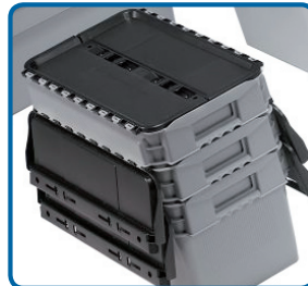
Apilables y encajables.