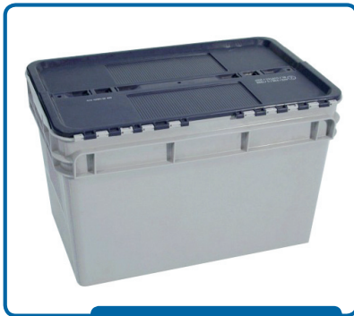
Homologada UN con tapa azul