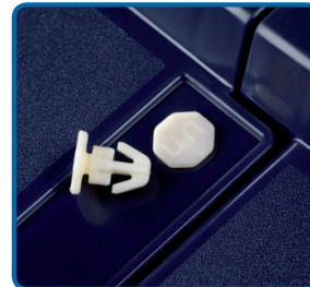
Precintables con tacos de plástico